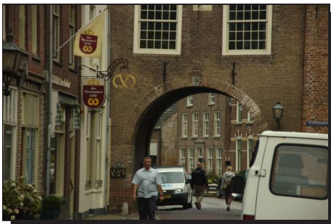
Abbildung 3: Altstadt von Buren

Wir blieben noch einen Tag auf dem Campingplatz in Erichem . Mit einem kurzen Ausflug nach Buren und ein paar notwendigen Einkäufen, inklusive Brennsprit und weiterer Karten, verbrachten wir den Rest des Tages. Außerdem versuchten wir unsere Sachen zu trocknen, räumten unsere Taschen aus und wieder ein und tranken die ersten heißen, selbst gekochten Getränken auf dieser Tour.