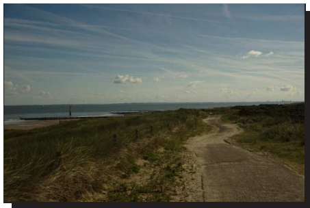
Abbildung 7: Radwege durch die Dünen

sen am Strand rundeten einen sehr schönen und interessanten Tourtag ab.