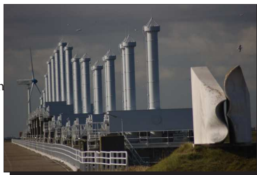
Abbildung 6: Oosterscheldekering

Hier wurde ein kilometerlanges Schutzsystem zur Abwendung von Hochwasser und Sturmfluten aufgebaut. Es existieren noch weitere, ähnliche Anlagen entlang der niederländischen Küste, die dem gleichen Zweck dienen. Die Oosterschelde Sturmflutwehr gilt als eines der größten Bauprojekte der Welt. Die Kosten hierfür betragen 2,5 Milliarden €. Die Eröffnung erfolgte im Oktober 1986 durch Königin Beatrix. In der Tat beeindruckend was hier aufgebaut wurde.