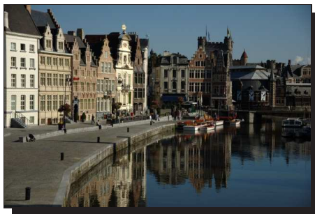
Abbildung 9: Gent, Graslei

Nach dem gestrigen Tag beschlossen wir im weitesten Sinne der Flandern Radroute (Rundweg mit ungefähr 800 Kilometer Gesamtlänge) nach Maastricht zu folgen.