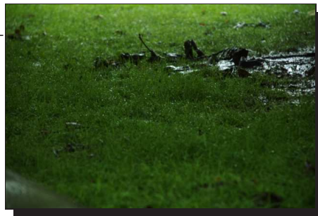
Abbildung 12: Es regnet...

Das schlechte Wetter hatte uns wieder. Bereits gestern erreichten wir Maastricht im Regen. An diesem Zustand hat sich auch am heutigen Tage nicht viel geändert. Wir sind mit dem Bus (Haltestelle vor dem Campingplatz) in die Stadt gefahren. Das erste was wir dort machten war ein Schirm zu kaufen. Aber die »gute Laune« wollte sich nicht einstellen. Letztlich sind wir nach ein paar Geschäften, Kaufhäusern sowie zwei Cafe's zurück zum Platz gefahren. Das Essen im dortigen Restaurant rettete den Tag schließlich doch noch halbwegs.