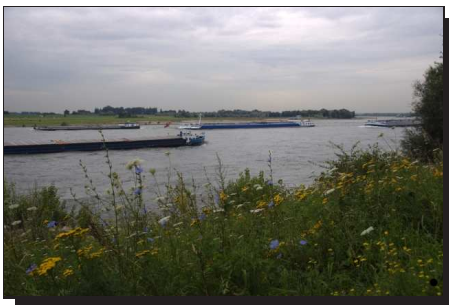
Abbildung 1: Rhein bei Wesel

Mit einem Tag Verspätung ging es heute los. Zunächst nach Siegburg und mit dem Zug nach Wesel. Die übliche Plackerei, sprich dem Runtertragen der Räder und am anderen Bahnsteig wieder hoch, folgte eine kurze Fahrt durch Wesel.