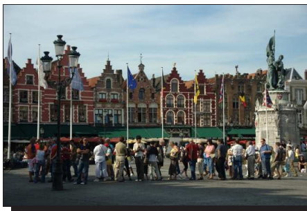
Abbildung 8: Marktplatz in Brügge

Bummel durch Brügge , der Hauptstadt der belgischen Provinz Westflandern . Die im Zentrum gelegene Altstadt wurde im Jahr 2000 von der UNESCO zum Weltkulturerbe erklärt. Die historische Innenstadt ist sehr gut erhalten und läßt sich zu Fuß oder auf einer der zahlreich angebotenen Kanalarundfahrten erkunden. Zu den Sehenswürdigkeiten zählen unter anderem der Marktplatz, Belfried, Liebfrauenkirche sowie der Begijnenhof.