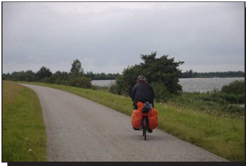
Abbildung 5: Grevelingendamm

Welch eine Überraschung, in der Nacht setzte Regen ein. Aber da das Wetter in den letzten Tagen einem bestimmten System folgte, stellten wir uns diesmal darauf ein. Los ging es mit Regen und keinerlei Wind. Gegen Mittag erreichten wir den Grevelingendamm , eine Verbindungsstraße zweier Inseln und einem Nistplatz zahlreicher Vogelarten. Zu der Zeit schlug auch wieder das Wetter um, kein Regen mehr, da-