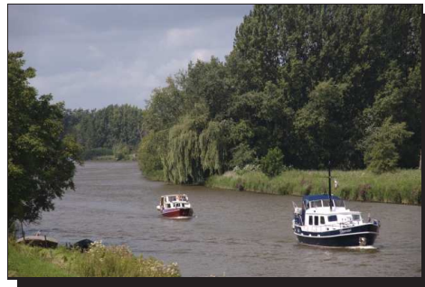
Abbildung 4: Lingen-Route

Einen Teil davon kürzten wir ab, so daß wir am späten Vormittag in Leerdam ankamen. Leider mit Plattfuß, aber das neue Pannenspray wirkte Wunder, so daß wir relativ schnell weiter konnten. Leerdam ist in erster Linie für seinen Käse gleichen Namens bekannt. Allerdings sind hier auch mehrere Glasbläsereien vor Ort. Vielfach ist es möglich, den Handwerkern bei der Arbeit zuzusehen und natürlich auch deren Produkte käuflich zu erwerben.