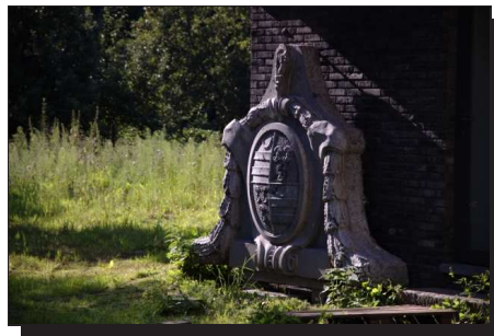
Abbildung 10: Auf dem Gelände einer ehemaligen Abtei

Bei der tropischen Mittagshitze sind wir nach ein paar Photos weiter nach St-Katelijne-Waver . Der dortige Campingplatz ist auf dem Gelände einer alten Abtei untergebracht. Teile hiervon sind immer noch vorhanden und können besichtigt werden.